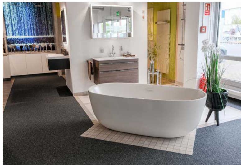
Für jeden Geschmack findet sich in der Badausstellung die passende Einrichtung.

Rosche selbst verkörpert diesen Weg wie kaum ein anderer: Er begann 1998 als Azubi, durchlief den Vertrieb sowie die Warenbeschaffung und lenkt den Betrieb nun seit zweieinhalb Jahren als Teil des dreiköpfigen Vorstands. Er kennt jede Ecke des Unternehmens – und hat sein eigenes Bad natürlich auch mit ELGORA-Produkten ausgestattet.