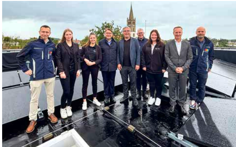
Die Projektbeteiligten freuen sich über die sinnvolle Dachnutzung.