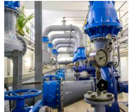
Vom Wasserwerk Sachsenhausen gelangt das Trinkwasser in bester Qualität nach Oranienburg.

www.stadtwerke-oranienburg.de/originalwasser